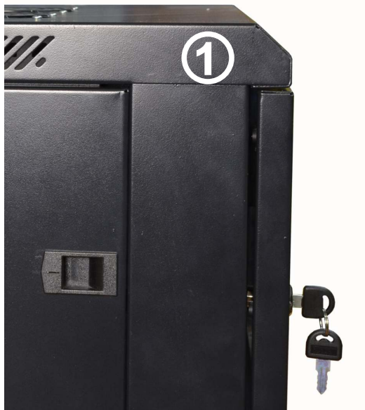
Montaż: lewa strona szafy.