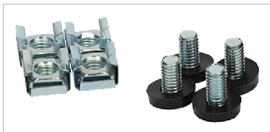
zestaw śrub oraz koszyków do montażu listwy